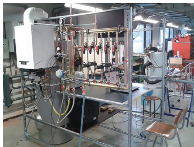
1 | Proefopstelling voor het meten van de SWW-productierendementen volgens het Ecodesignprincipe